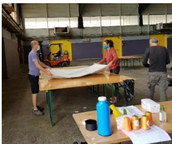
Découpe du tissu