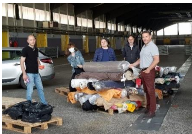
Réception de la livraison de rouleaux de tissus au Parc des Expos de Lorient

Patron optimisé, pour la confection de surblouses, téléchargeable en suivant ce lien